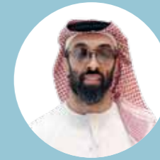
سمو الشيخ طحنون بن زايد آل نهيان رئيس مجلس الإدارة