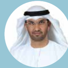
معالي د. سلطان أحمد الجابر عضو مجلس الإدارة