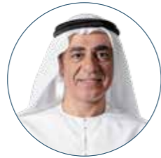
فاضل العلي نائب الرئيس التنفيذي ورئيس الخدمات المصرفية للشركات والاستثمار للمجموعة