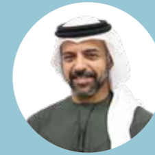
معالي الشيخ محمد بن سيف بن محمد آل نهيان نائب رئيس مجلس الإدارة